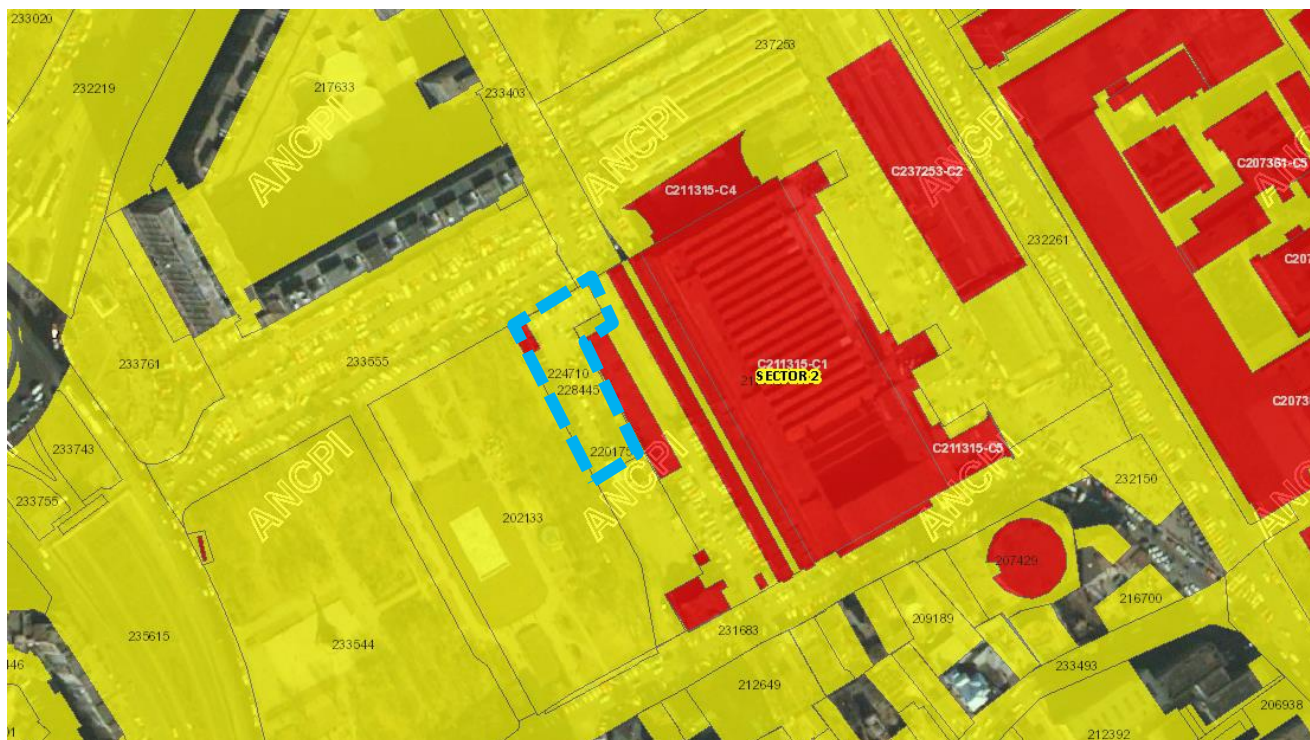
Extras din ANCPi – Imobile eTerra

Conform PUZ Strada Câmpul Moșilor nr 5, Sector 2, București , aprobat prin HCGMB nr 256/14.12.2015 , documentatie aflata in valabilitate in prezent, urmând a fi implementată în cadrul reglementărilor din cadrul PUZ sector 2, în urma dezbaterii în cadrul comisiilor de specialitate și a comisiilor tehnice din cadrul Primăriei Municipiului București.