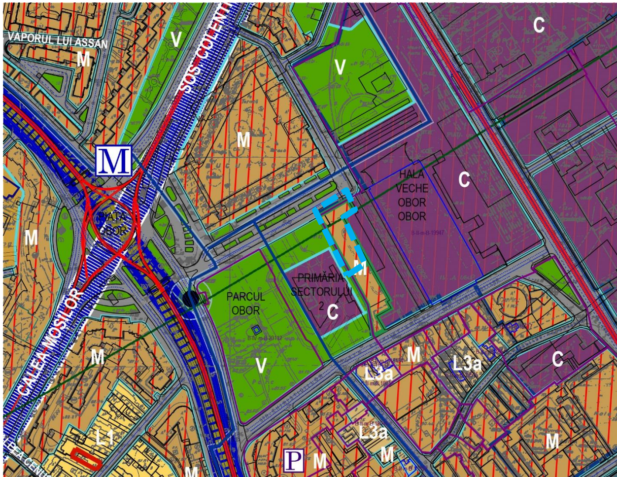
Extras din PUZ Sector 2, aflat in faza Informarea Populatiei, Faza a III-a

Planul Urbanistic Zonal al Sectorului 2 presupune un proces de integrare a reglementarilor Planului Urbanistic General Bucuresti, documentatiile in vigoare si cele in curs de aprobare si in acelasi timp raspunzand necesităților populației.